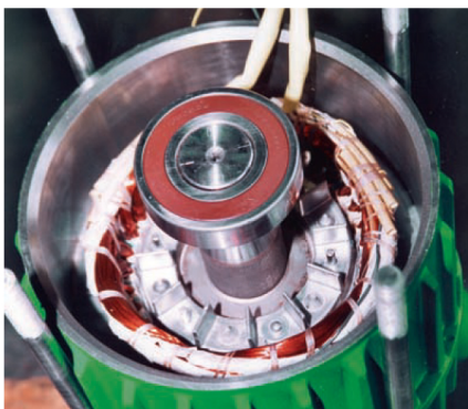
Stator (elektrische Wicklung) und Rotor bei GTWS