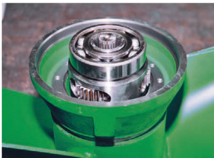
Planetengetriebe für GTWS 1540/204