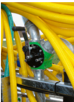
Dreiweghahnen manuell Vannes à 3 voies manuelle