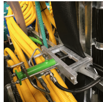
Fremdkörperabscheider hydraulisch Séparateur hydr. de corps étranger