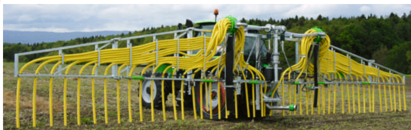
Mini-Pac 15m mit 2 Verteilerköpfen. Mini-Pac 15m avec 2 têtes de distributions.