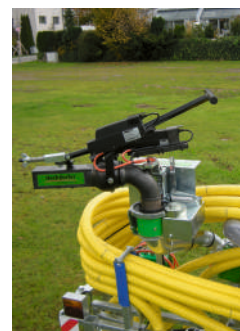
Elektrischer Schwenkverteiler Répartiteur pendulaire électrique