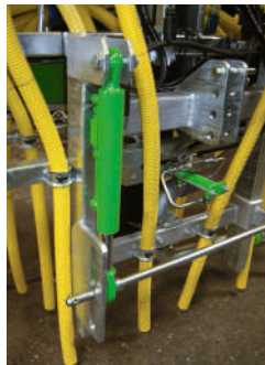
Hangausgleich Compensateur de déclivité