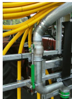
Kugelhahnen hydraulisch Vanne à boule hydraulique