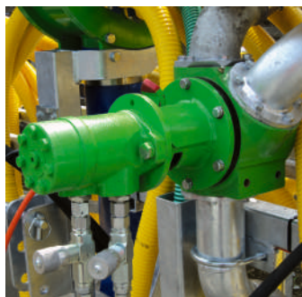
Dreiweghahnen hydraulisch Vannes à 3 voies hydraulique