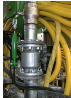
Durchflussmessgerät Appareil de mesure du débit